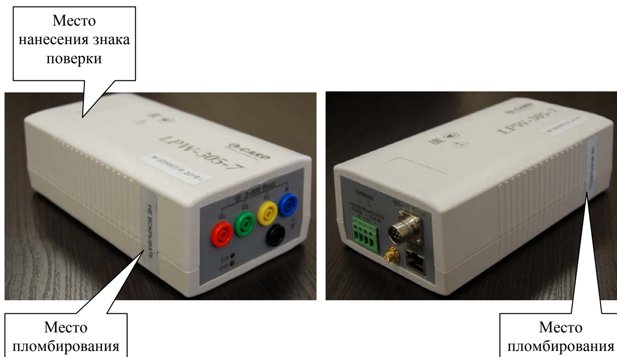
Рисунок 3 – Внешний вид измерителей портативного типа, места их пломбирования и нанесения знака поверки